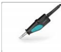
PA120-A - Pinzas Micro