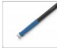
T245-PA - Mango Azul