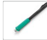
T245-NA - Mango Nitrógeno