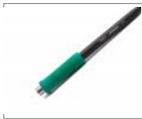
T245-A - Mango de uso general