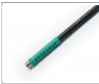
T245-B - Mango antideslizante